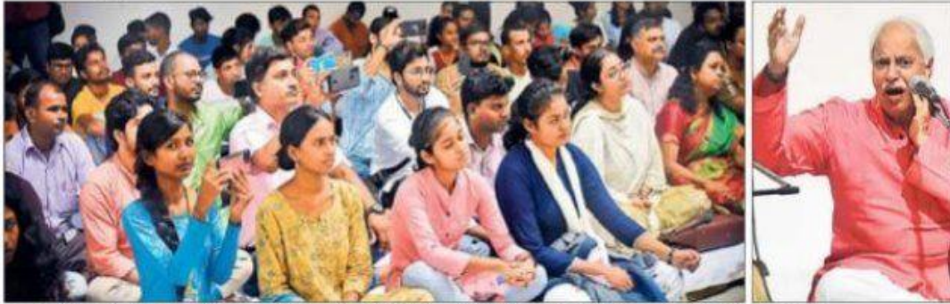
कला एवं शिल्प महाविद्यालय में मंगलवार को शास्त्रीय संगीत की प्रस्तुति देते बनारस घराने के गायक पद्मभूषण पं साजन मिश्रा.