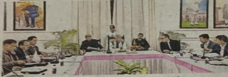
राजभवन में शुक्रवार को कुलपतियों के साथ बैठक करते राज्यपाल फगू चौहान।

राज्य ब्यूरो पटना : राज्यपाल एवं कुलाधिपति फगू चौहान की अध्यक्षता में शुक्रवार को राजभवन में राज्य के विश्वविद्यालयों के कुलपतियों की समीक्षा बैठक में लंबित शैक्षणिक सत्र और परीक्षाओं पर चर्चा हुई। इसके बाद राज्यपाल ने कुलपतियों को सभी परीक्षाएं सम्पत्तीमा के अंदर कराने और ससमय रिजल्ट देने का आदेश दिया। ताकि सत्र नियमित हो सके। विद्यार्थियों को डिग्रियों के वितरण में देरी न हो : राज्यपाल ने बैठक में कुलपतियों से डिग्रियों के वितरण की प्रगति की जानकारी ली और आदेश दिया कि विद्यार्थियों को डिग्रियों को उपलब्ध कराने में देरी नहीं होनी चाहिए। जो परीक्षाएं हो चुकी हैं उनके रिजल्ट जल्द जारी करना सुनिश्चित करें। बैठक में डिग्रियों के आनलान्डन वितरण की जानकारी कुलपतियों से ली गई। साथ ही राज्यपाल ने सत्र नियमित करने, विश्वविद्यालयों और इनके क्षेत्र अंतर्गत आनेवाले महाविद्यालयों के शिक्षकों एवं शिक्षकेतर कर्मचारियों के सेवांत लाभ एवं अन्य महत्वपूर्ण विषयों के बारे में जानकारी ली। न्यायालय संबंधी मामलों के