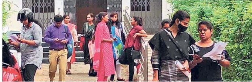
पीयू में पीएचडी की परीक्षा देने के बाद बाहर आते छात्र-छात्राएं

छात्र-छात्राएं एक घंटे पूर्व ही केंद्र पर पहुंच गये थे, आधा घंटा पहले प्रवेश बंद कर दिया गया