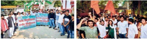
चुनाव को लेकर स्टूडेंट्स से मिलते छात्र जदयू के सदस्य.