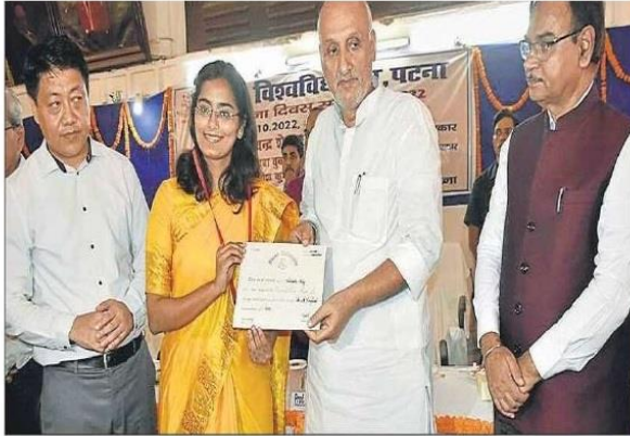
Education minister Chandra Shekhar felicitates students on the 106th foundation day function of Patna University on Saturday. Female students once again outshone their male counterparts by winning 41 out of 66 gold medals at the convocation.

पटना लॉ कॉलेज में सीट कटौती में वापसी की मांग पटना. पीयू के स्थापना दिवस समारोह में पहुंचे बिहार के शिक्षा मंत्री प्रो चंद्रशेखर को आइसा, एआइएसएफ पटना विश्वविद्यालय इकाई ने ज्ञापन सौंपा और परेशानियों से अवगत कराया. आइसा ने सात सूत्री मांगों का ज्ञापन शिक्षा मंत्री को सौंपा. ज्ञापन में पटना लॉ कॉलेज सीट कटौती वापस लेने, पटना विश्वविद्यालय में स्थायी प्रोफेसर्स एवं कर्मचारियों की नियुक्ति करने आदि की मांग रखी है.