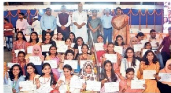
पटना विश्वविद्यालय का स्थापना दिवस समारोह पर गोल्ड मेडल से सम्मानित किए गए छात्र-छात्राएं।