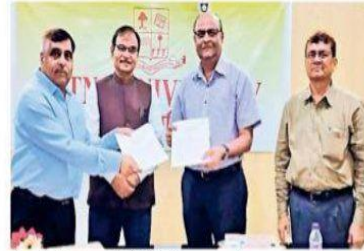
पीयू और सैम ह्यूस्टन स्टेट विवि के बीच हुआ एमओयू.

पटना विश्वविद्यालय ने शनिवार को अमेरिका के टेक्सास स्थित सैम ह्यूस्टन स्टेट यूनिवर्सिटी के साथ समझौता ज्ञापन पर हस्ताक्षर किया है. इस एमओयू के बाद दोनों विश्वविद्यालयों में शिक्षकों, विद्वानों और प्रशासकों का दौरा और अनौपचारिक आदान-प्रदान होगा. दोनों स्नातकोत्तर विभाग शिक्षा और प्रशिक्षण में एक दूसरे का सहयोग करेंगे. परस्पर हित के विषयों पर संयुक्त सम्मेलन, सेमिनार या अन्य वैज्ञानिक बैठकें आयोजित की जाएंगी. दोनों के बीच स्नातक, स्नातकोत्तर छात्र और पोस्टग्रेजुएट छात्रों के आदान-प्रदान के लिए रास्ते तलाशे