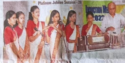
मगध महिला कालेज में एजुकेशन मीट में प्रस्तुति देती छात्राएं।